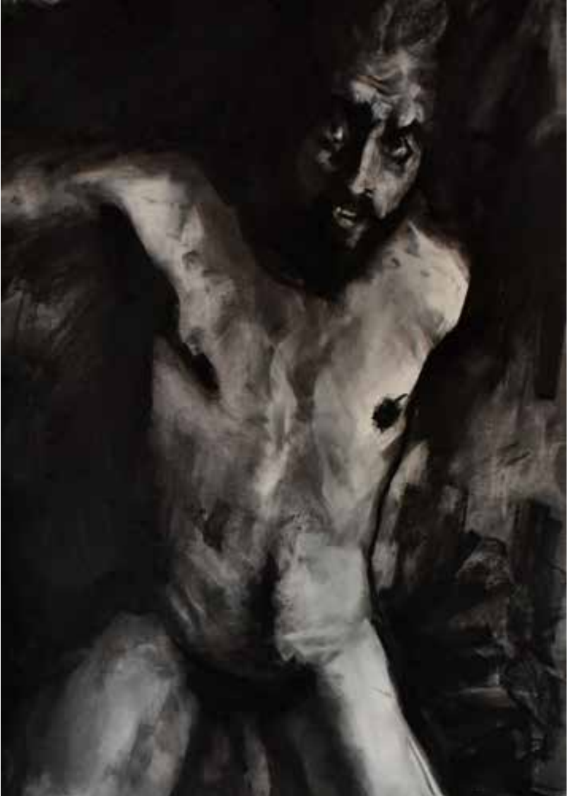
"El cuerpo persiste". 2023. 55 x 80 cm Mixto sobre papel. TRÍPTICO C