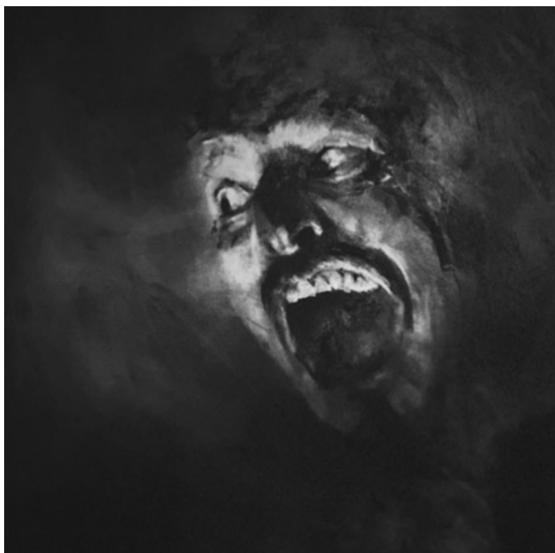
"Retrato Aceleracionista". 2022. Carboncillo sobre papel. 1 x 1 mt.