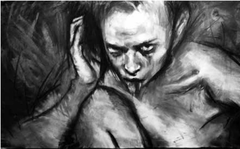
Sin nombre. 2021. Carboncillo sobre papel. 1 x 1.75 mts