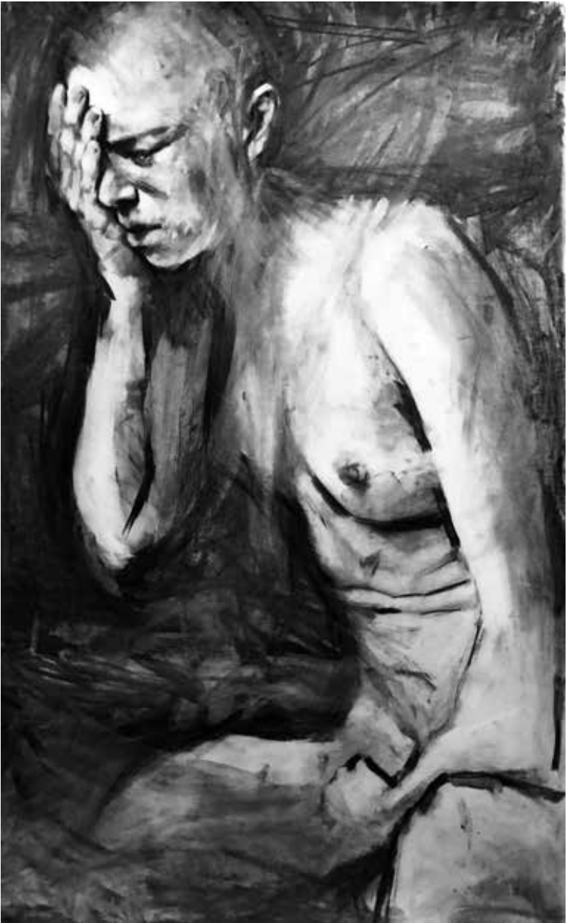
"Burnout". 2021. Carboncillo sobre papel. 1.75 x 1 mts