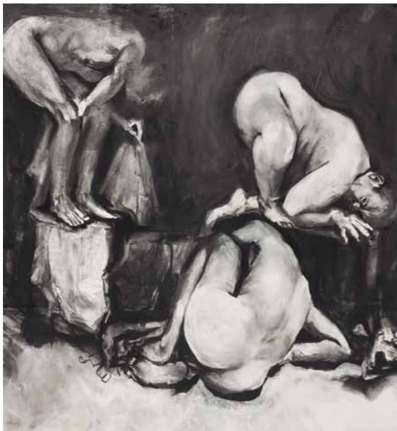
"Humanización" 2023. Mixta sobre papel. 1 x 1 mt