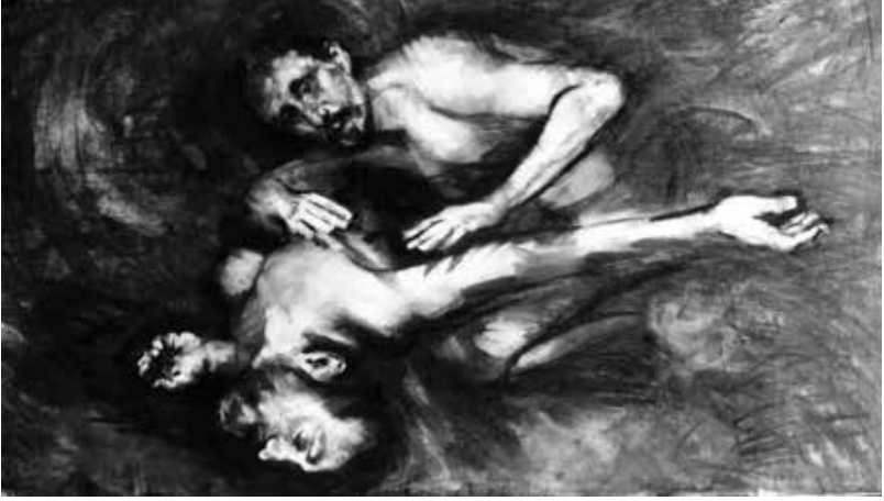
"Couplings XI". 2022. Carboncillo sobre papel. 1 x 2 mts.