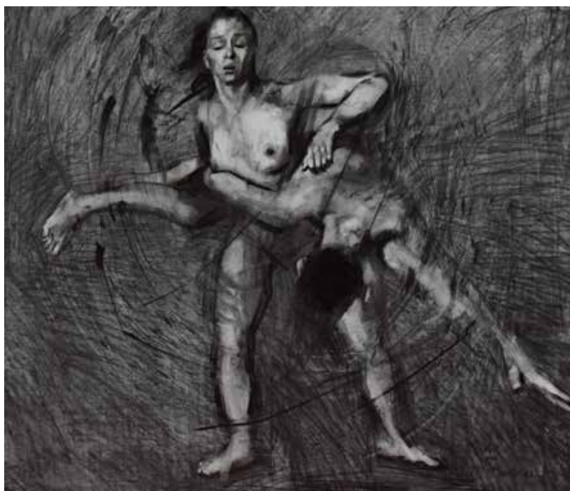
"Anagrama". Couplings XII. 2022. Carboncillo sobre papel. 1.07 x 1 mt