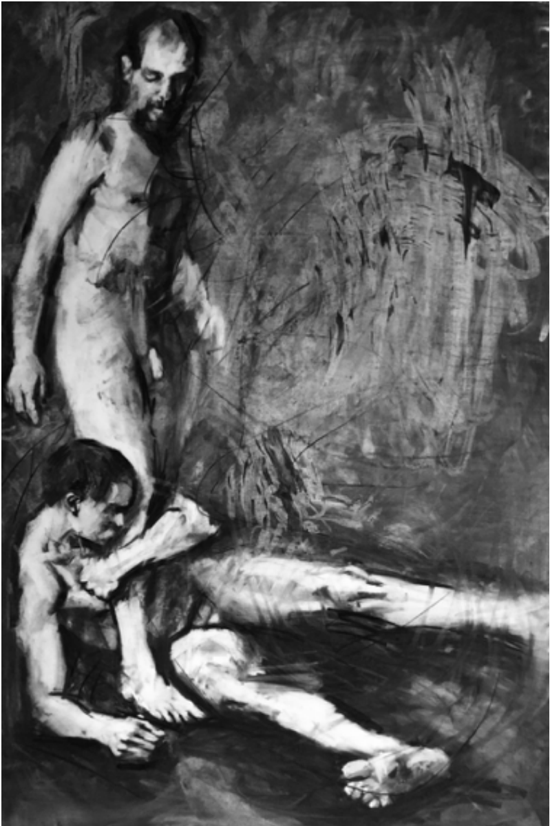
"El descarte". 2022. Carboncillo sobre papel. 1.07 x 1.70 mts