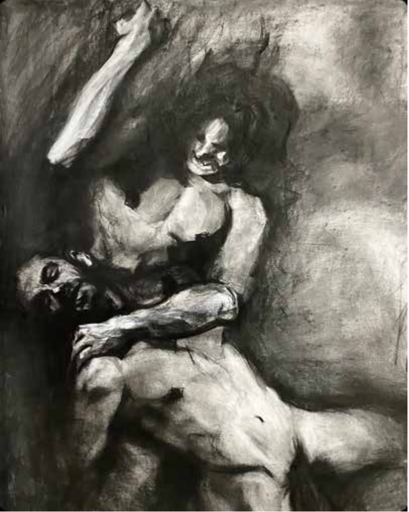
"La precariedad". 2024. Carboncillo sobre papel. 1 x 0.80 mts