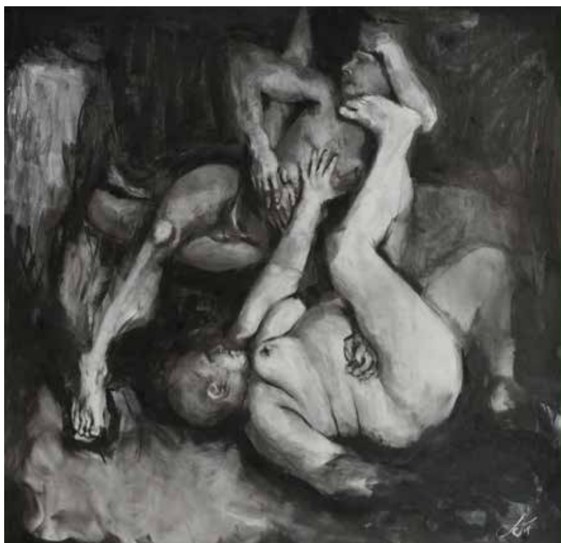
“El Dilema” 2023. Mixta sobre papel. 1 x 1 mt