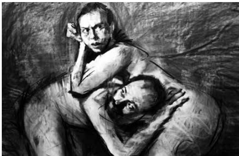
Couplings V". 2022. Carboncillo sobre papel. 1 x 1.50