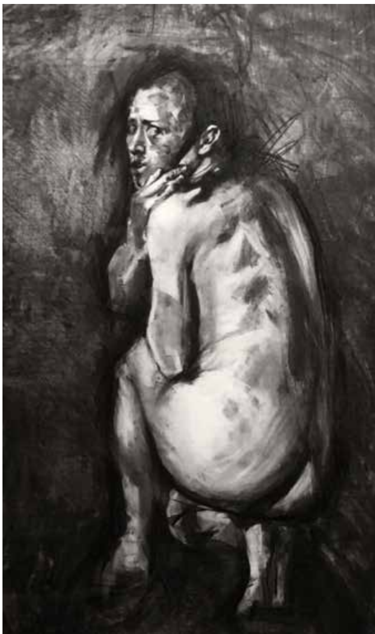
“Persona violentada”. 2021. Carboncillo sobre papel. 1.70 x 1 mt