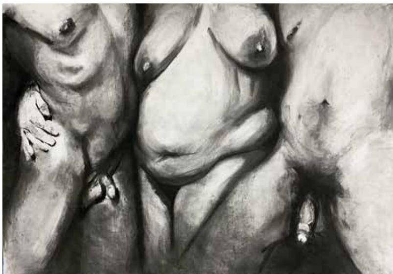
"Tres desnudos" 2024. Mixta sobre papel. 1.50 x 1 mt