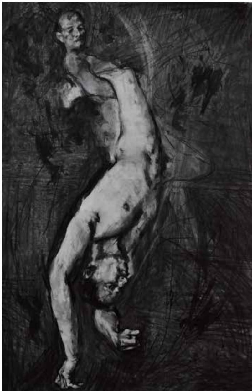
"Hombre Eyectado". 2022. Carboncillo sobre papel. 1,07 x 1,60 mts