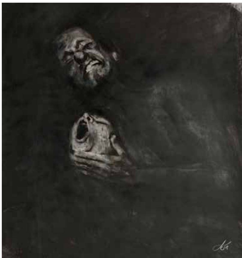
"Pluricultura". 2022. Mixto sobre papel. 1 x 1 mt