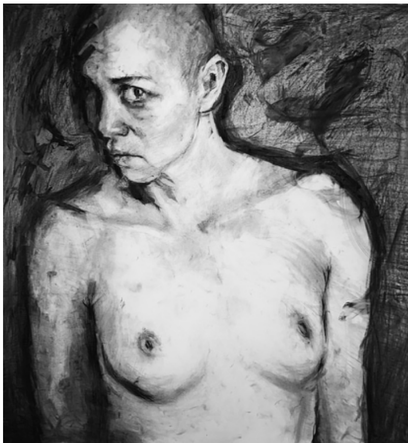
"Retrato Posmoderno". 2022. Carboncillo sobre papel. 1 x 1 mt.