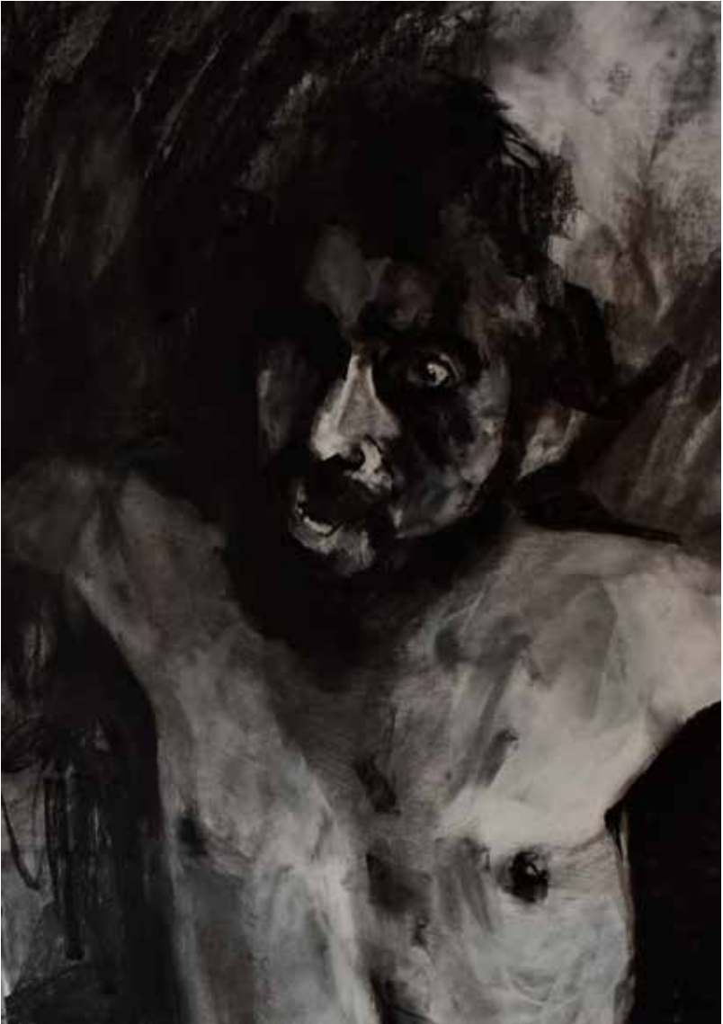
"El Cuerpo Persiste ". 55 x 80 cm 2023. Mixto sobre papel. TRÍPTICO B