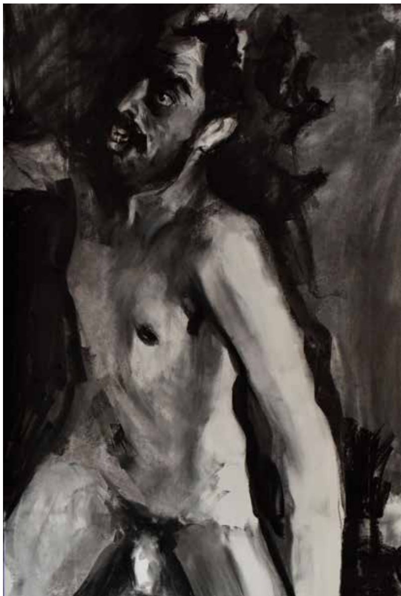
“El cuerpo persiste”. 2023. 55 x 80 cm Mixto sobre papel. TRÍPTICO C