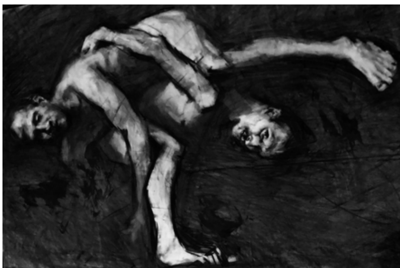
"Couplings X". 2022. Carboncillo sobre papel. 1.07 x 1.75 mts