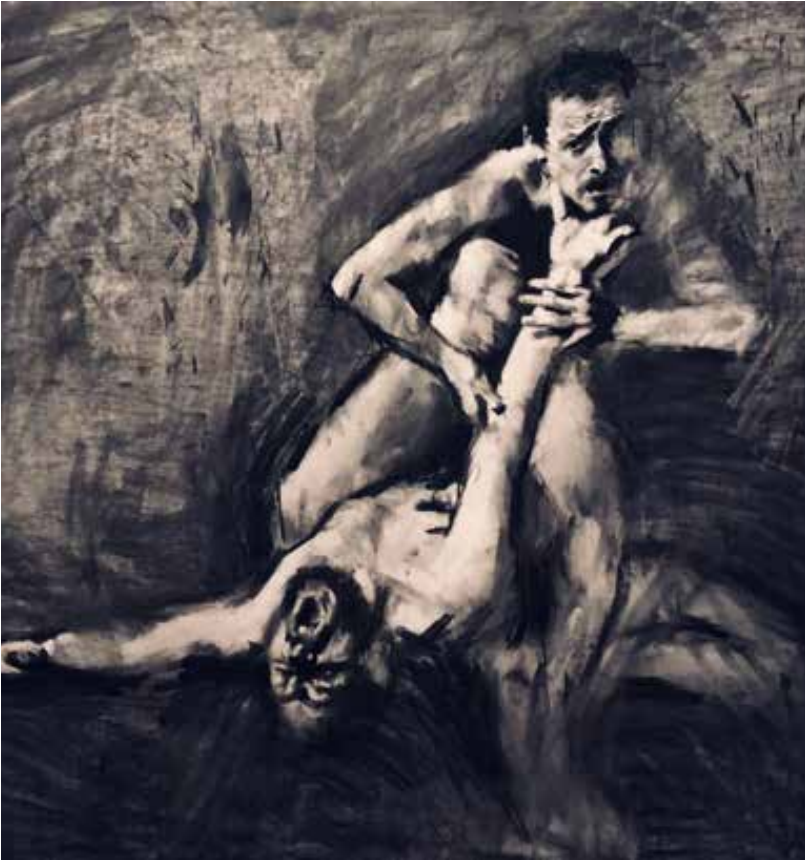
"Couplings VI". 2022. Carboncillo sobre papel. 1 x 1 mt