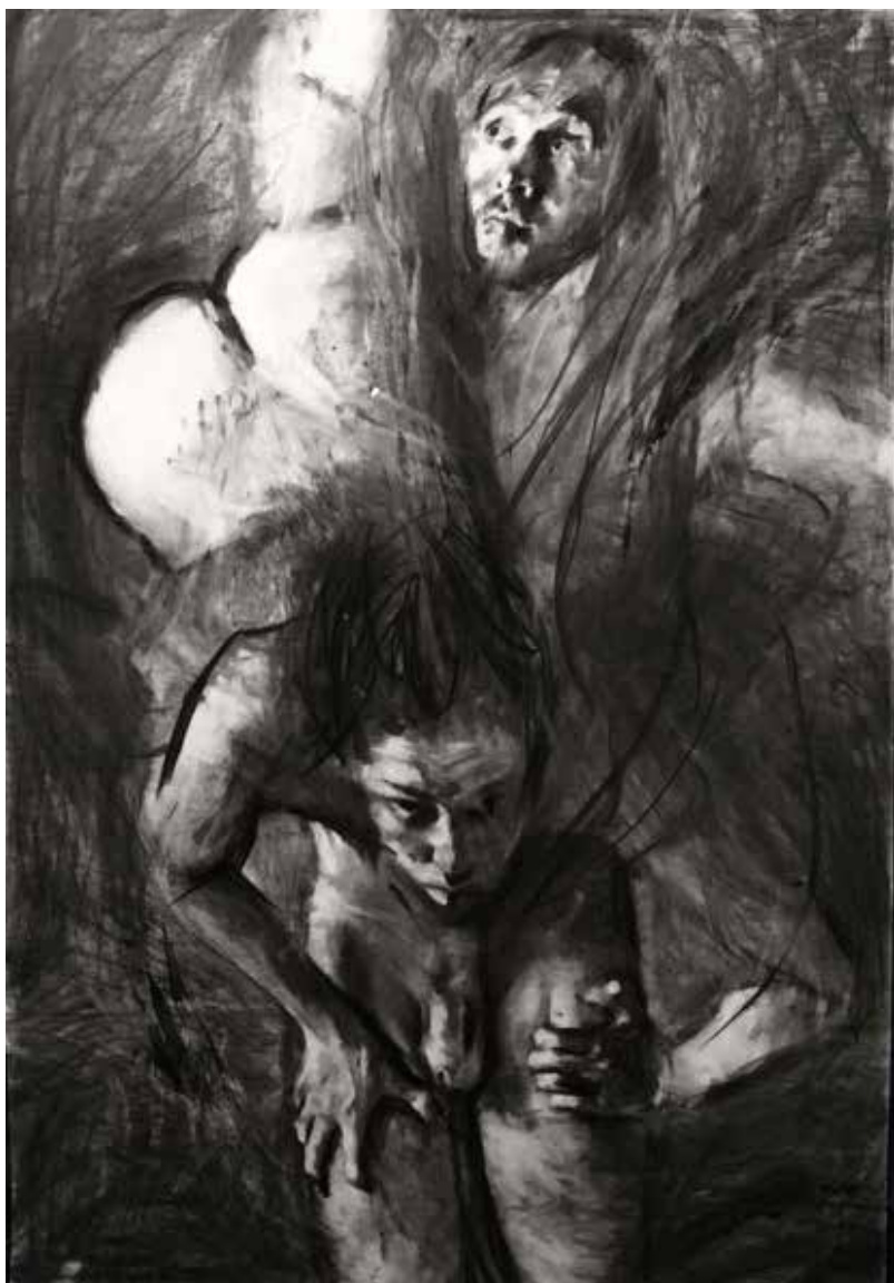
Couplings VII". 2022. Carboncillo sobre papel. 1.07 x 1.55 mts