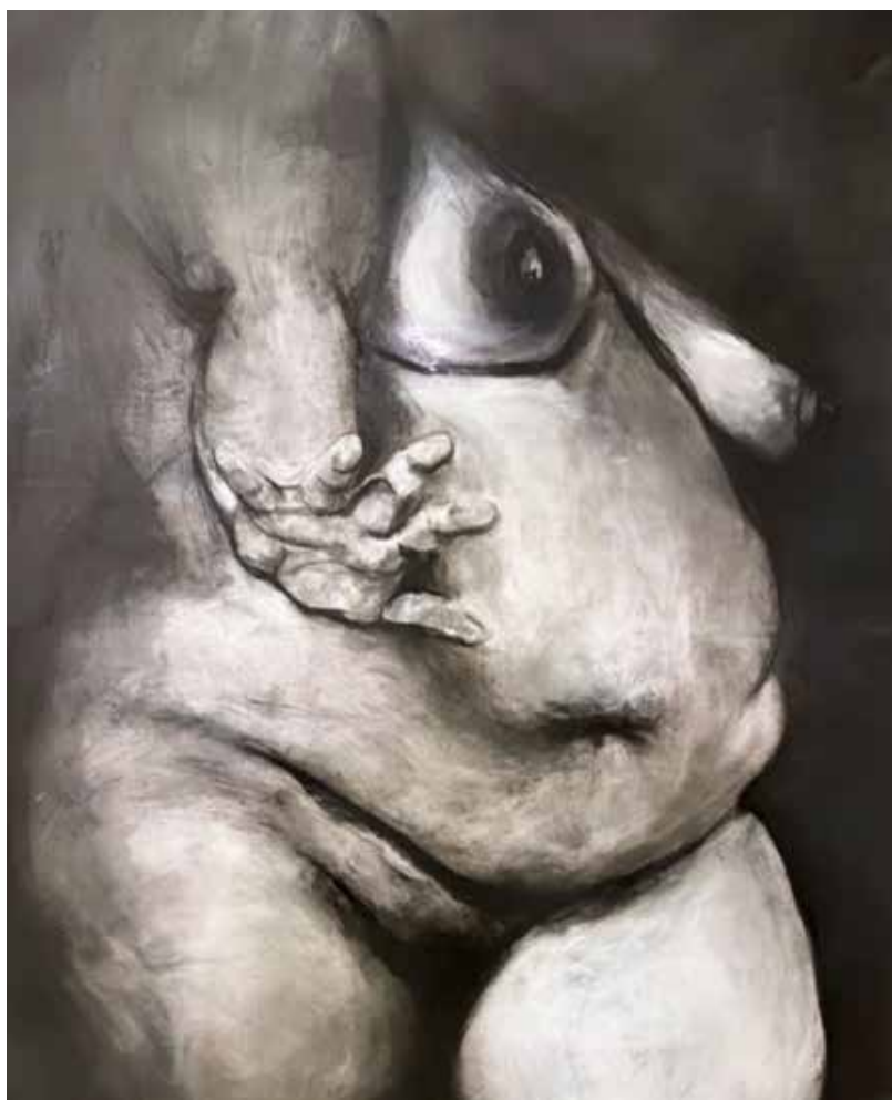
"Retrato Grandilocuente" 2023. Mixta sobre papel. 1.50 x 1 mt