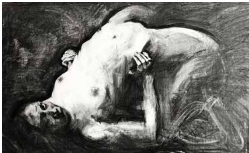
"Figura arqueada". 2021. Carboncillo sobre papel. 2.00 x 1.00 mts