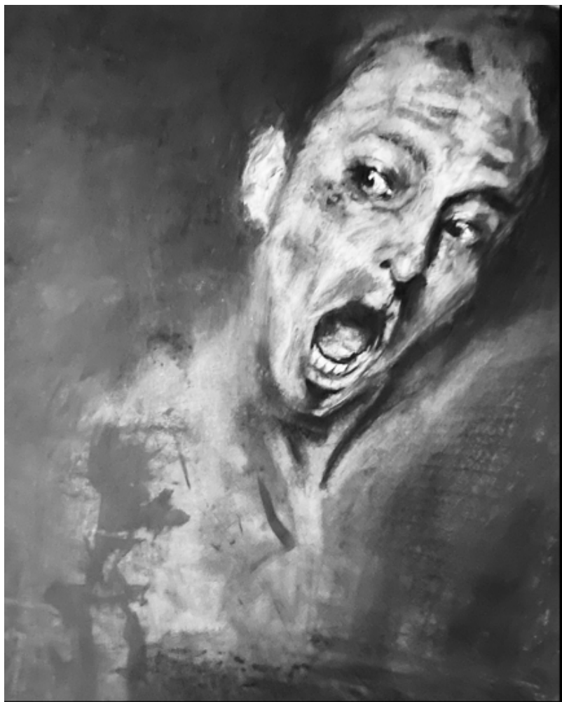
"Retrato Desquijarado". 2022. Carboncillo sobre papel. 1 x 0.80 mt.