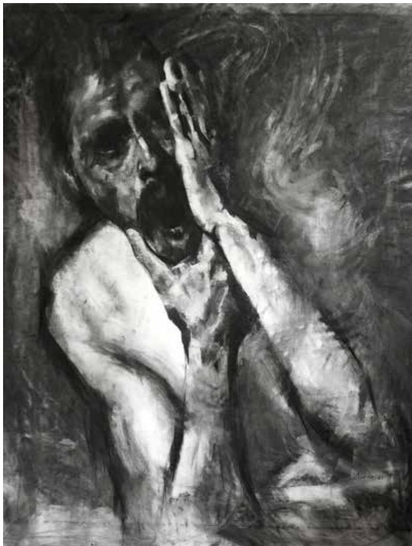
"Figura angustiada". 2021. Carboncillo sobre papel. 1.50 x 1.00 mts