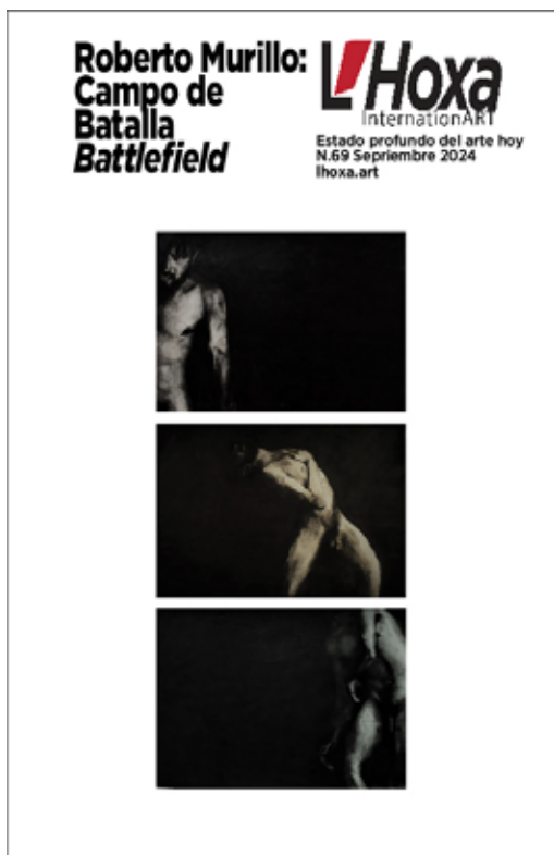
"Núcleo I, II y III". 2023. Mixto sobre papel. 1.50 x 1.07 mts.