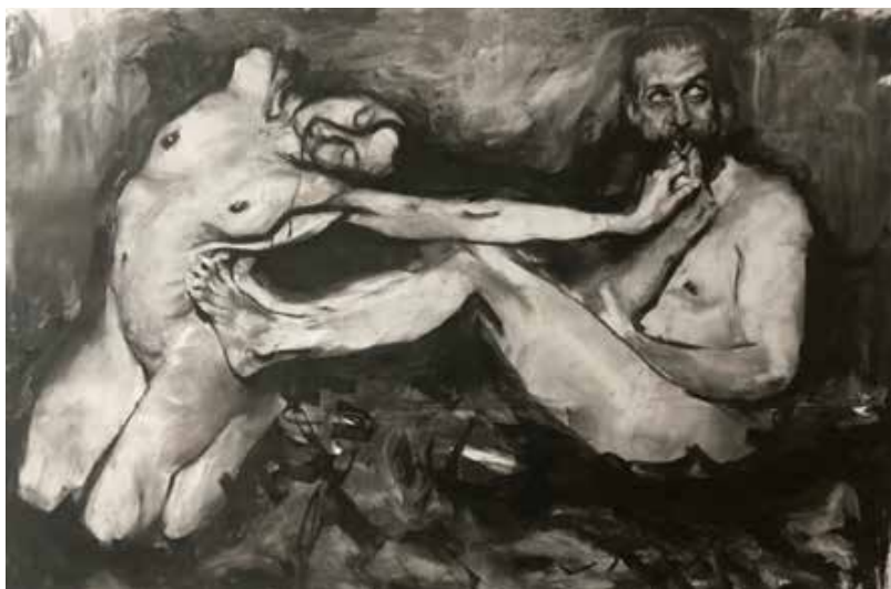
"La Contradicción". 2023. Mixta sobre papel. 1.07 x 1.70 mts