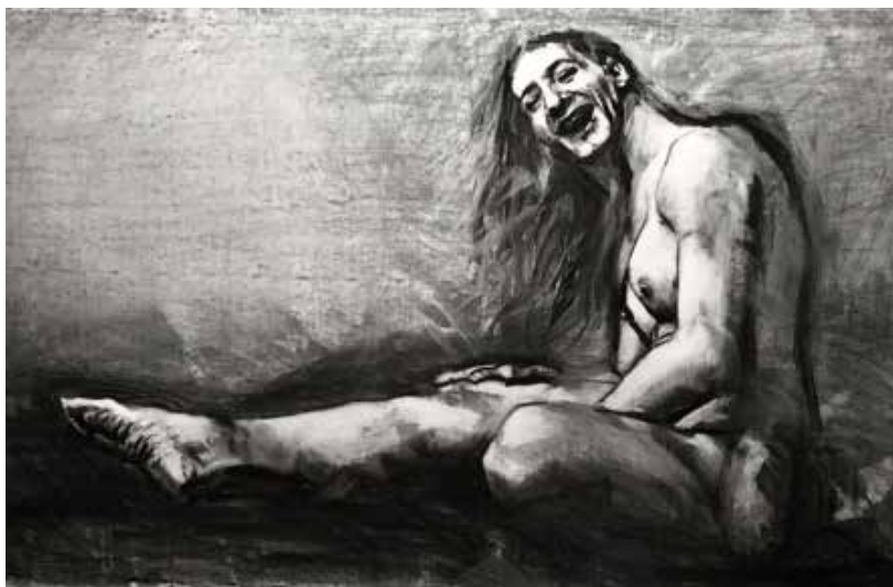
"Noam VI". 2022. Carboncillo sobre papel. 1 x 1.50 mts.