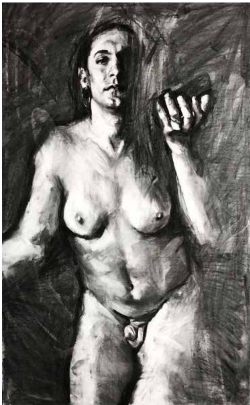
"Noam I". 2022. Carboncillo sobre papel. 1 x 1,50 mts