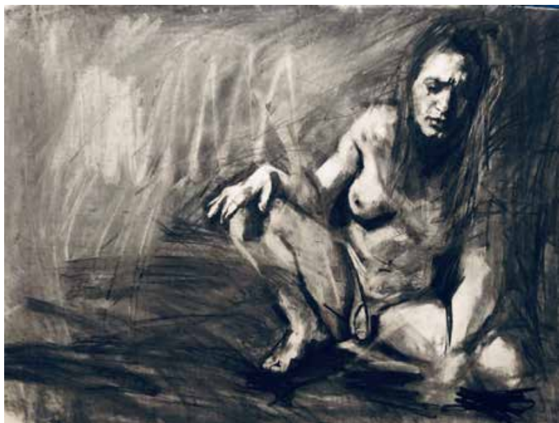
"Noam IV". 2022. Carboncillo sobre papel. 1 x 1,50 mts.